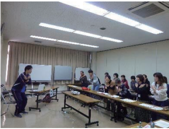
ボランティア養成研修の様子