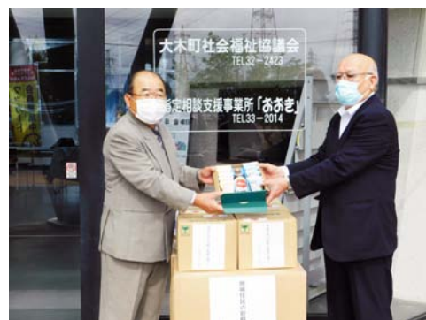
JA福岡大城組合長様(右)より当社協会長(左)へ寄贈の様子

いただいた食料品は、新型コロナウイルス感染症の影響により支援を必要とされている方をはじめ、生活にお困りの方等へ配分させていただきました。ありがとうございました。